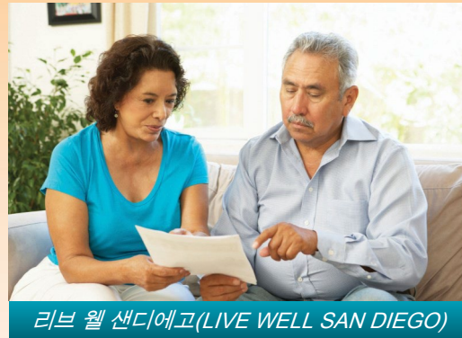
리브 웰 샌디에고(LIVE WELL SAN DIEGO)

정신 건강 플랜은 심각하고 지속적인 정신 건강 문제를 겪고 있는 자격이 있는 성인, 노인 및 아동에게 양질의 정신 건강 서비스를 제공하기 위해 최선을 다하고 있습니다. 정신 건강 서비스는 비밀이 보장되며 모든 사람은 정신 질환으로부터 회복할 능력이 있고 실제로 회복할 수 있다는 신념을 바탕으로 합니다. 정신 건강 문제로 도움을 구하는 데는 큰 용기가 필요할 수 있지만, 전화 한 통화면 도움을 받을 수 있다는 사실을 기억해주시요.