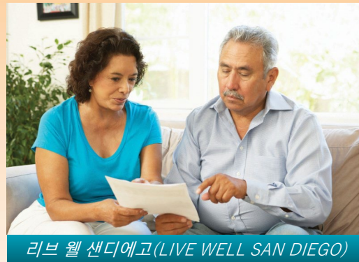
리브 웰 샌디에고(LIVE WELL SAN DIEGO)

정신 건강 플랜은 심각하고 지속적인 정신 건강 문제를 겪고 있는 자격이 있는 성인, 노인 및 아동에게 양질의 정신 건강 서비스를 제공하기 위해 최선을 다하고 있습니다. 정신 건강 서비스는 비밀이 보장되며 모든 사람은 정신 질환으로부터 회복할 능력이 있고 실제로 회복할 수 있다는 신념을 바탕으로 합니다. 정신 건강 문제로 도움을 구하는 데는 큰 용기가 필요할 수 있지만, 전화 한 통화면 도움을 받을 수 있다는 사실을 기억해주시요.