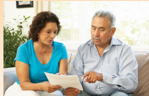
عش سعيدًا في سان دييجو

مشاكل الصحة العقلية الخطيرة والمستمرة. خدمات الصحة العقلية محاطة بالسرية وهي تستند على الاعتقاد بأن في إمكان الناس الشفاء من المرض العقلي وهم يشفون منه. على الرغم من أن طلب المساعدة لحل مشاكل الصحة العقلية يمكن أن تشكل تحديًا، فإن المساعدة على بعد مكالمات هاتفية.